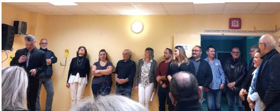
Discours de M. le maire entouré d'une partie du Conseil municipal