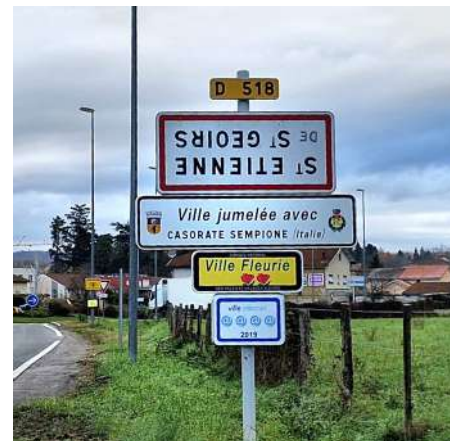
Saint-Michel, Brion, Brezins, Saint-Étienne... : ici aussi, les panneaux étaient “tout retournés” !