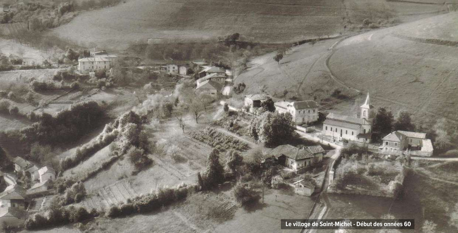
Le village de Saint-Michel - Début des années 60

Le 30 juin 1958 , est construit un chemin desservant deux mairies, l'un sur Saint-Michel, l'autre sur Saint-Geoirs dont le maire propose l'achat du terrain de Charles Bréchon, au prix de 80 000 F. Chaque commune versera 40 000 F.