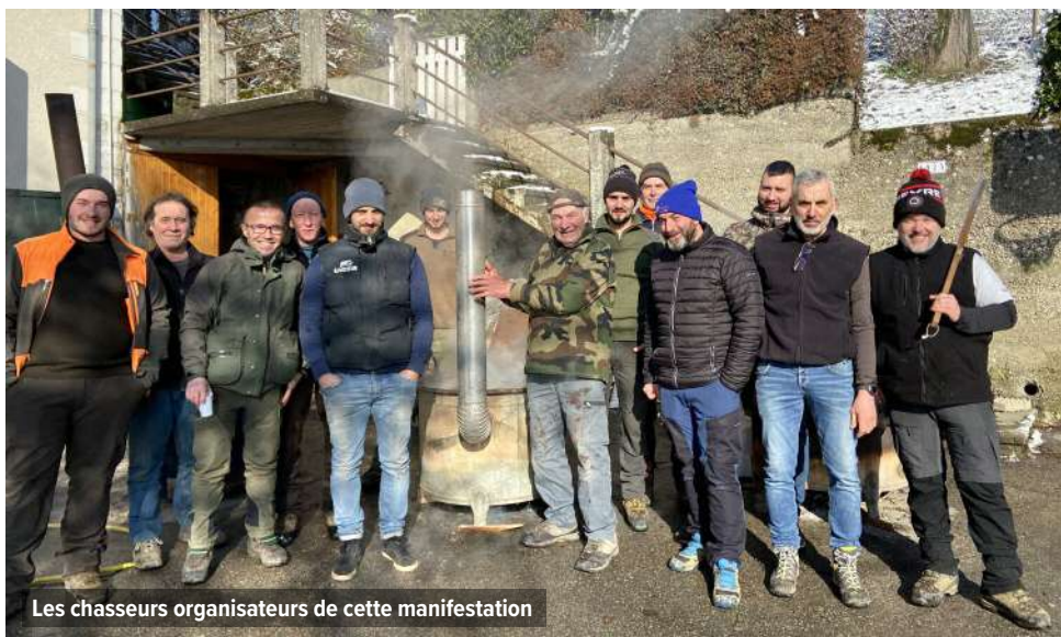
Les chasseurs organisateurs de cette manifestation

Maintenant place à quelques battues au renard pour limiter les dégâts sur le petit gibier.