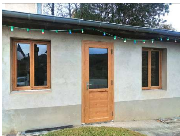
La salle du club des aînés